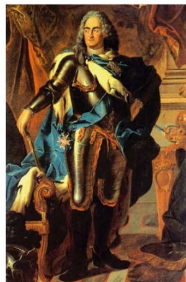
August II Mocny (*1670 †1733), król Polski w latach 1697–1733. Słynął z siły fizycznej, czemu zawdzięczał swój przydomek. Mówiono, że władca potrafił złamać rękoma żelazną podkowę.

August II chciał wzmocnić swoją władzę w Rzeczypospolitej i unowocześnić państwo na wzór rządów Ludwika XIV we Francji. Dlatego w imieniu Saksonii zawarł przymierze z Rosją, która walczyła ze Szwecją w tak zwanej wojnie północnej (1700–1721). Król liczył, że dzięki zwycięstwu nad Szwecją zdobędzie silną pozycję w Rzeczypospolitej i przeprowadzi planowane reformy. Jednak Szwedzi pokonali w 1702 roku Rosjan i Sasów, po czym wkroczyli na terytorium Rzeczypospolitej. W tej sytuacji August II porzucił polski tron i uciekł do Saksonii.